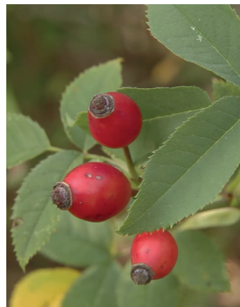
Cynorrhodons et folioles dentés.