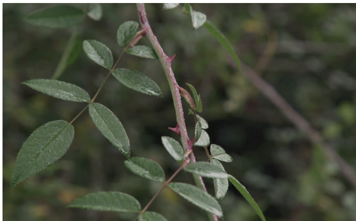
Feuille composée pennée, à 5 à 7 folioles ovales et dentées.