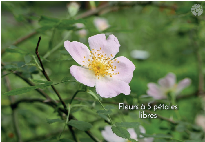
Fleurs à 5 pétales libres