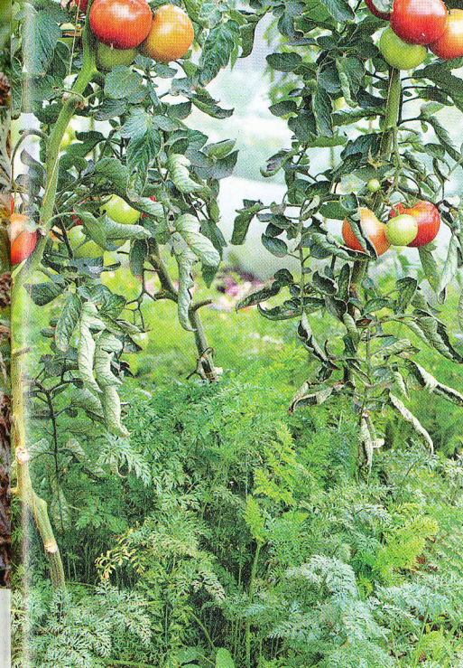
Les associations de cultures sont largement pratiquées : ci-dessus, sous serre, les tomates côtoient les carottes. A droite, sur les buttes rondes, aucune fertilisation n'est effectuée.

Ici, on laisse grainer les plantes pour qu'elles